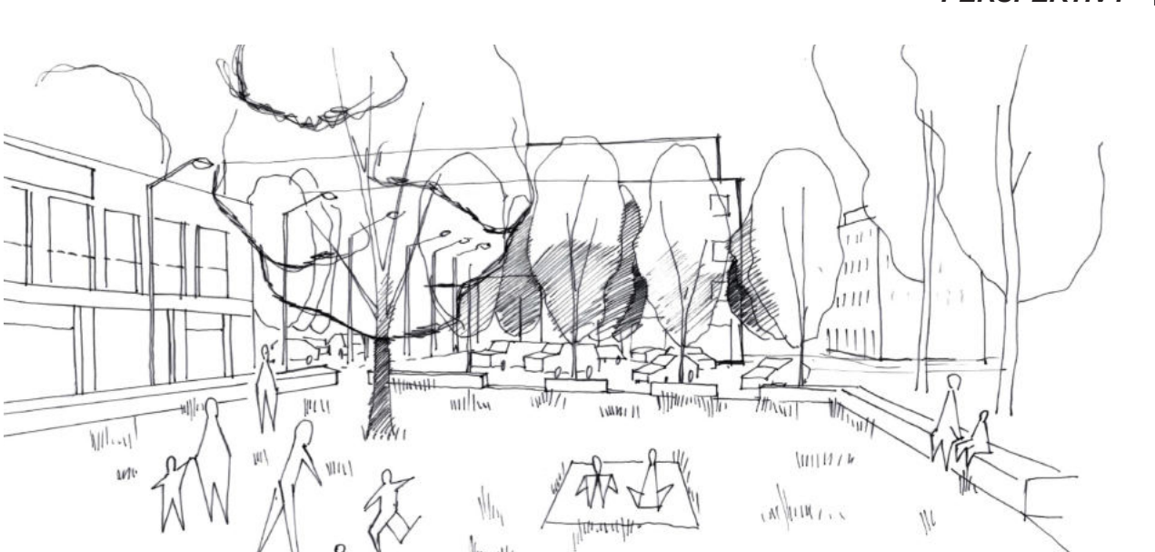
ZELENÉ NÁMĚSTÍ Předprostor komunitního centra - pracovním nazýváme Zelené náměstí, je travnatou plochou, s betonovou obrubou k vymezení ploch a funkčnímu využití. Hrací plocha komunitního centra, udržovaný trávník pro hru i odpočinek, vsakovací plocha - náměstí, po kterém se rádi projede bosí.