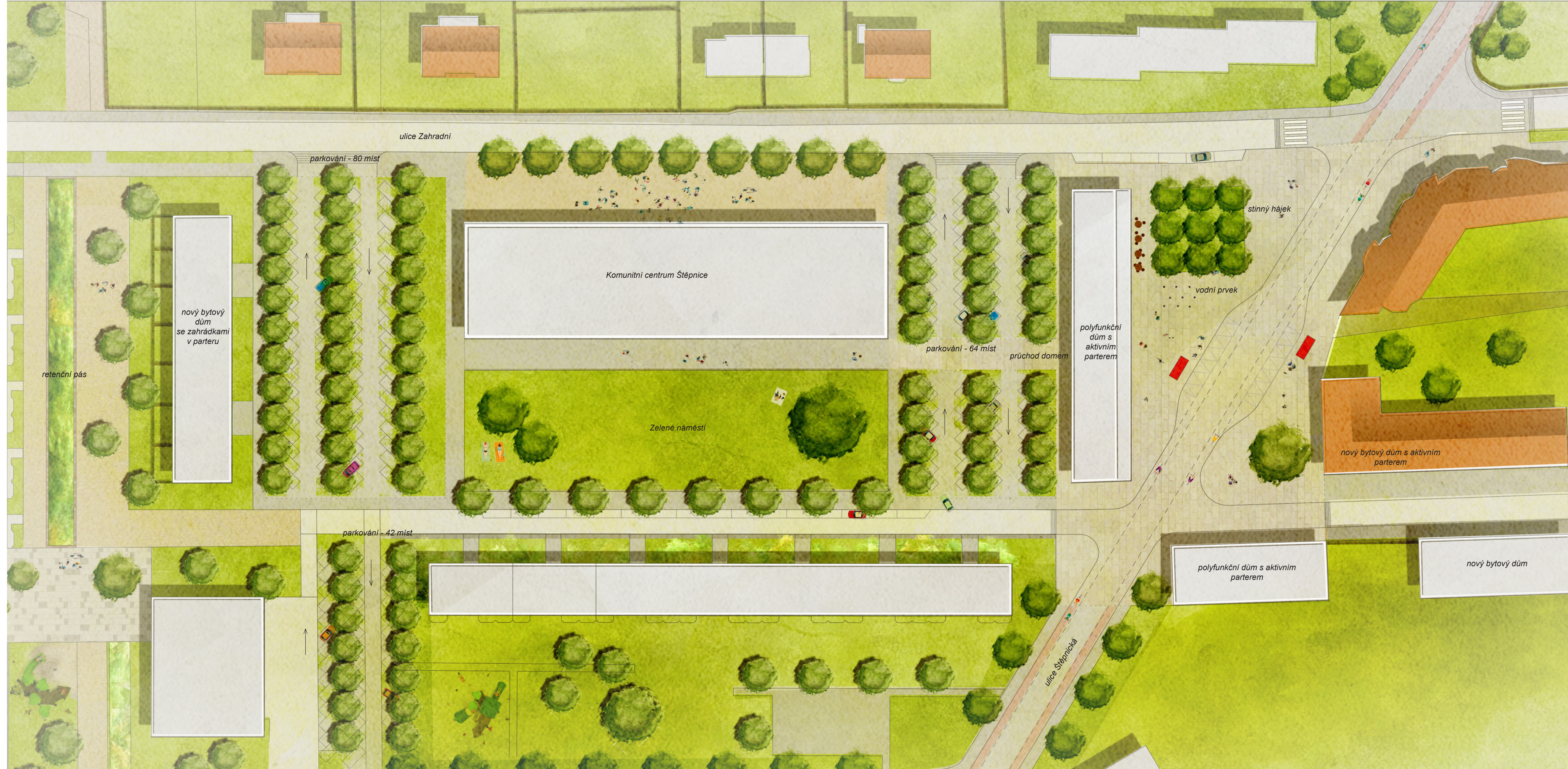
NÁVRH - SITUACE 1:500