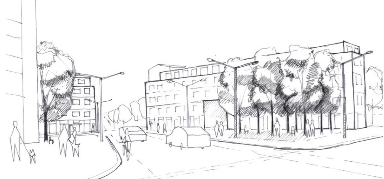
NÁMĚSTÍ ŠTĚPNICKÉ Nové navrhované polyfunkční domy s aktivním parterem pomáhají dovolit plochu náměstí. Vzniká městský prostor, který je pomyslnou branou do sídliště Mojžíš, a je veřejným prostranstvím městského charakteru, které Štěpnicí chytlo.