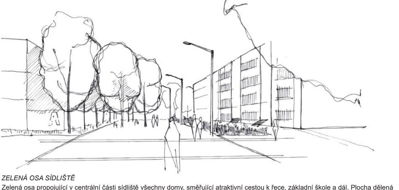
ZELENÁ OSA SÍDLIŠTĚ Zelená osa propojuje v centrální části sídliště všechny domy, směřující atraktivní cestou k škole, základní škole a dále. Plocha dělená segmenty na několika příjemných zastávkách. Při užití posazení ve svislé stěně, pevná vozová hřiště, kde se později se sousoyí dětské hřiště u školy, retenční systém vsakovacích pásů vedoucích třeba do komunitního sadu v jižní části sídliště. Příjemná cesta, která nabídně parádní pocit z kvalitního veřejného prostoru.