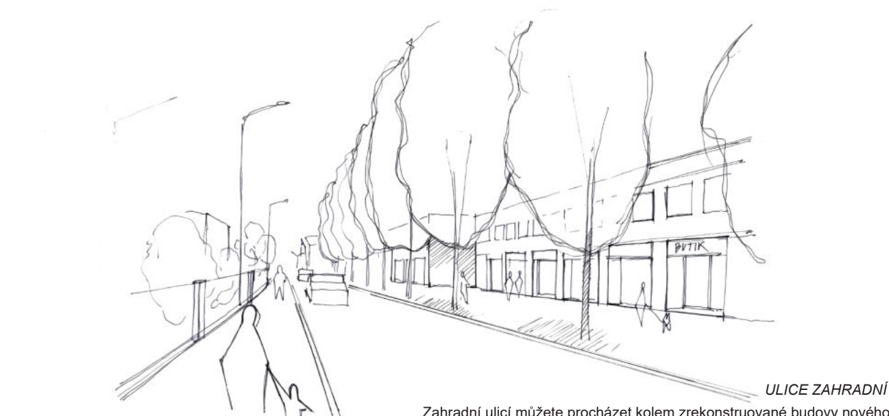
ULICE ZAHRADNÍ Zahradní ulici můžete procházet kolem zrekonstruované budovy nového Komunitního centra - z této starší domy je v aktivním parteru možnost pronájmu obchůdku, malé provozovny, ateliéru apod.