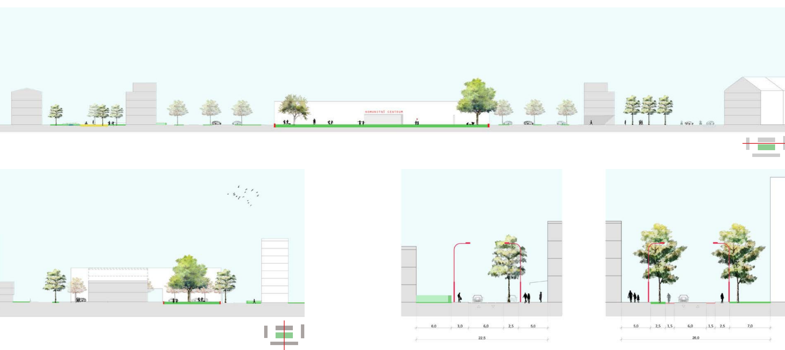
ULICE ZAHRADNÍ - OKRUŽNÍ Ulice Jana Evangelisty Purkyně je nejvýznamnější automobilovou spojkou Štěpnice s centrem města. V přízemí směru na ni navazuje ulice Zahradní. Okroužení kolem sídliště dokončí navazující Štěpnicka. Tato souhrnná ulice umožní obyvatelům a návštěvníkům pohodlně se dostat do svých domovů. ULICE ŠTĚPNICKÁ - HLAVNÍ OSA ŠTĚPNICKÉ Ulice Štěpnická je nejvýznamnější komunikací osou celé čtvrti. Spojuje Štěpnic s vlnovým nádrží s centrem města. Je důležitá, aby byl klidně velký úsek na bezpečný pohyb chodců a cyklistů. Osa je tvořena ulicemi Husova a Štěpnická, která plně pokrývají do krajiny osy směřem na Kurovce.